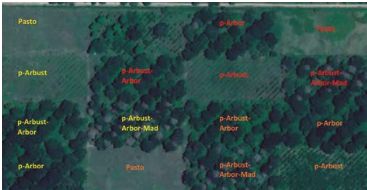
Figura 1. Imagen satelital de la distribución espacial de los sistemas silvopastoriles en el CI Turipaná (AGROSAVIA), en Cereté (Córdoba, Colombia). Bloque 1: naranja; bloque 2: rojo, y bloque 3: amarillo.

El experimento se desarrolló en un área de 30 ha, dividida por un efecto diferencial de drenaje en tres sectores caracterizados como bloques (drenaje deficiente, moderado y óptimo). En cada bloque, se estableció una repetición de los tratamientos evaluados en un área de 2 ha (100 m de ancho por 200 m de largo), para un total de tres repeticiones por tratamiento y 15 parcelas (figura 1). Cada tratamiento estuvo dividido en 5 franjas de 4.000 m 2 , sujetas a un esquema de pastoreo de 2 días de ocupación y 28 días de descanso.