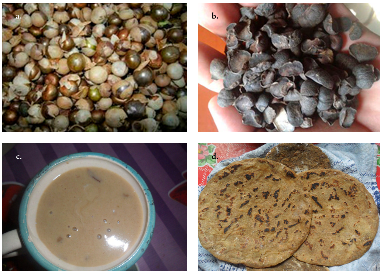
Figura 1. Semilla de ramón y sus usos en alimentos tradicionales. a. Semilla de ramón recién recolectada; b. Semilla de ramón seca; c. Atole con harina de semilla de ramón; d. Tortillas hechas a mano con harina de ramón.