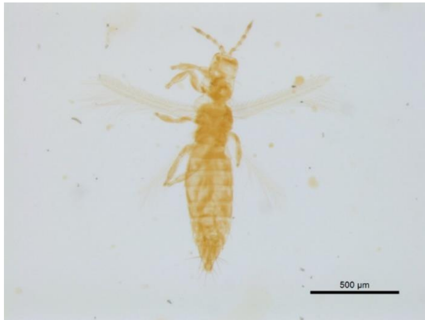
Figura 3. Espécimen de Frankliniella gossypiana Hood recolectado en inflorescencias de C. ensiformis en Coclé, Panamá.