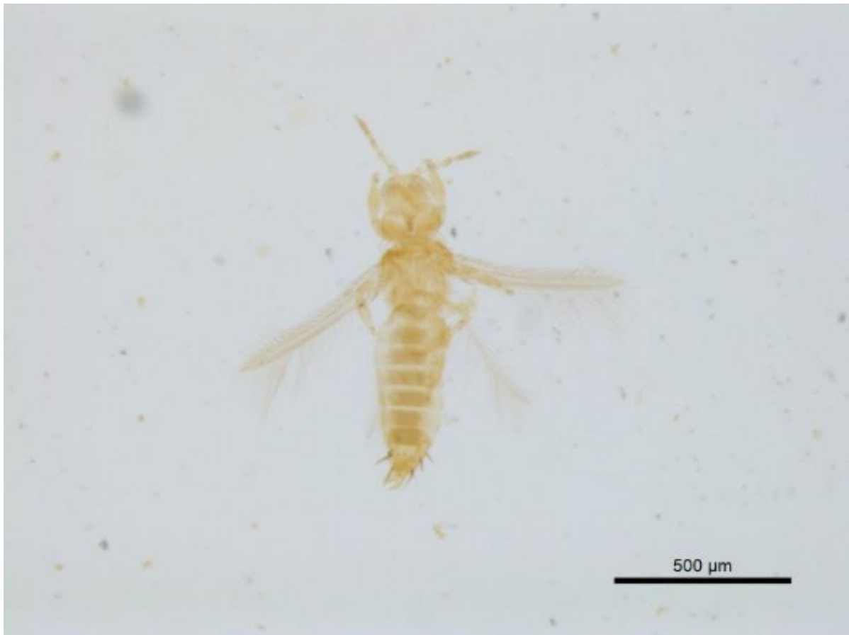
Figura 2. Espécimen de Frankliniella cephalica (Crawford) recolectado en inflorescencias de C. ensiformis en Coclé, Panamá.