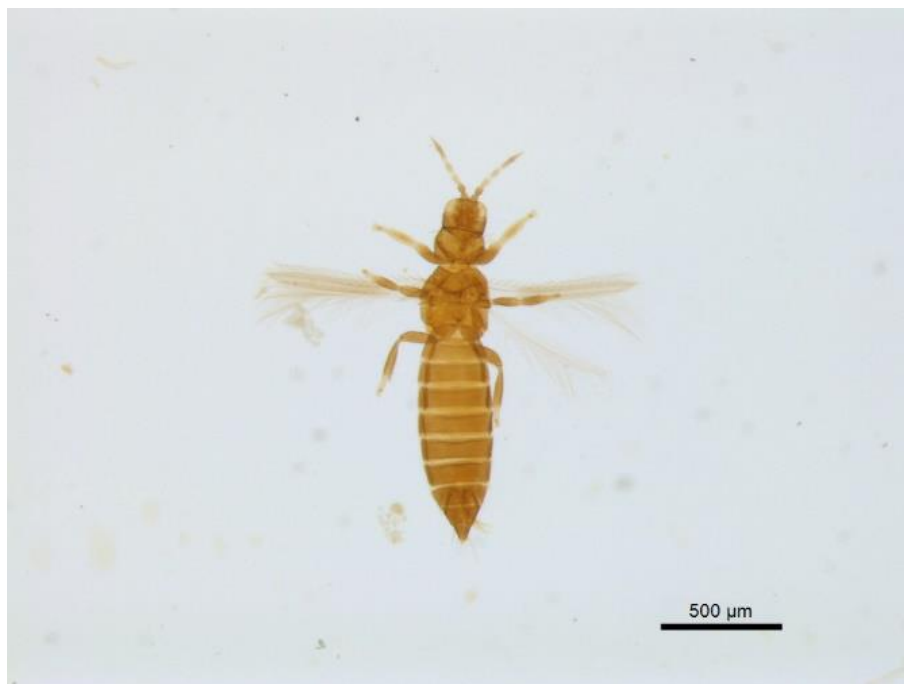
Figura 4. Espécimen de Frankliniella insularis (Franklin) recolectado en inflorescencias de C. ensiformis en Coclé, Panamá.