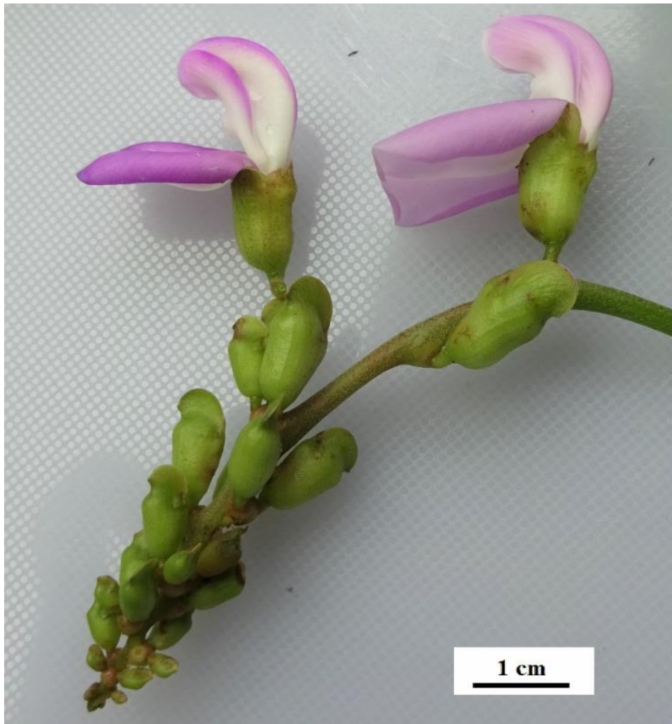
Figura 1. Flores de Canavalia ensiformis (L.)