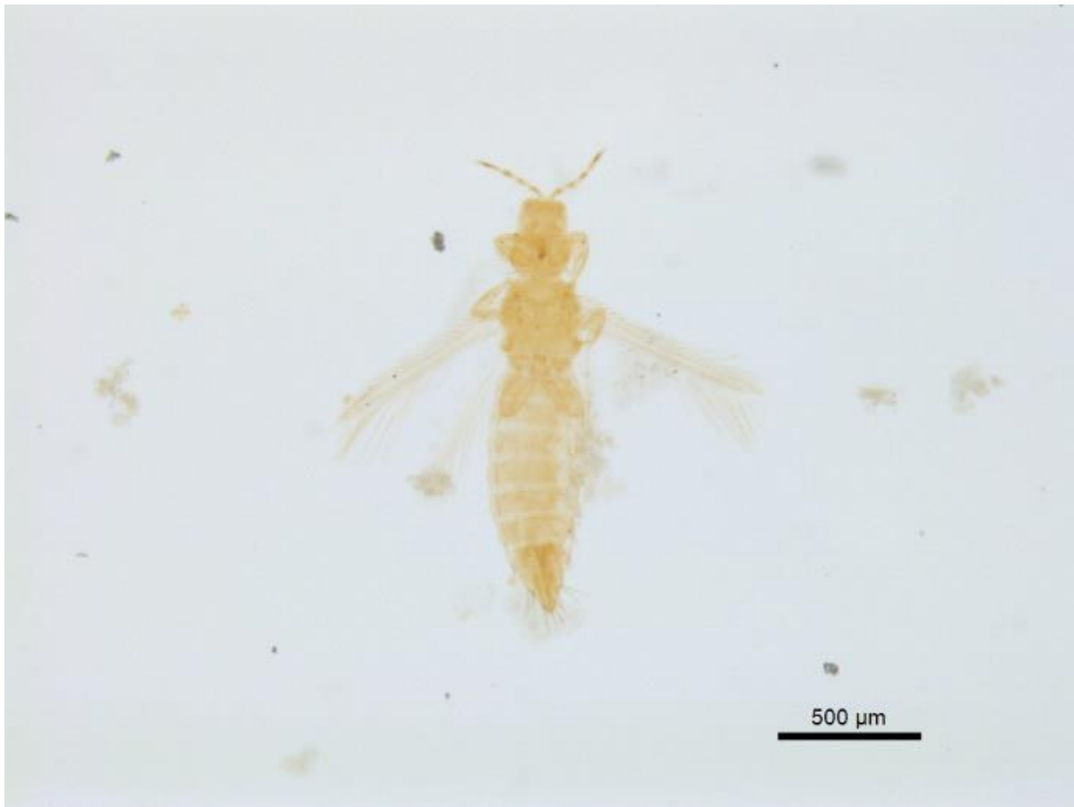
Figura 5. Especímen de Frankliniella williamsi Hood recolectado en inflorescencias de C. ensiformis en Coclé, Panamá.